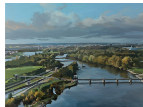
Till Warwas Blick auf die Weser nach Westen