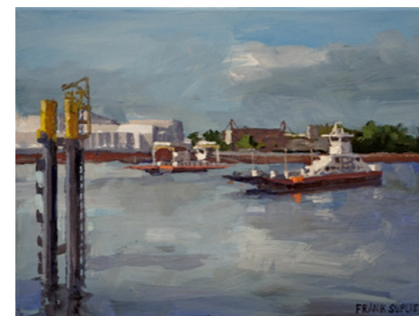
Frank Suplie Vegesack Fähren

5 € / ermäßigt 3,50 € Kinder bis 18 Jahre frei