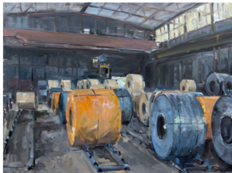
Tobias Duwe Rollenstahl, Stahlwerk