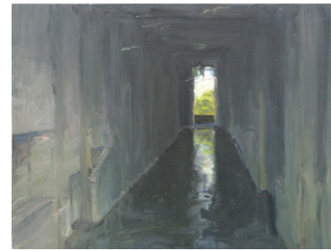
André Krigar Lethe 1 (Über das Vergessen)

Information und Anmeldung unter 0421 / 663 665