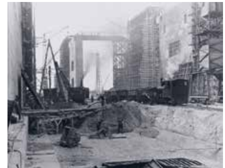
Baustelle Bunker „Valentin“, Sommer 1944