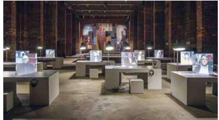
Blick in die Ausstellung im Dokumentationszentrum Reichsparteitagsgelände